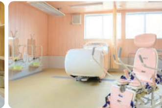
浴室には一般浴槽以外にも特殊浴槽も完備しており、身体の不自由な方も安心。