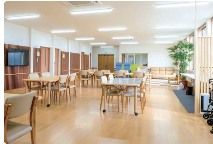
メインホールは、自然の光をふんだんに取り入れた安らぎの空間です。

宏川荘は小高い丘の上であり、眼下には雄物川が流れています。豊かな自然に囲まれてごゆっくりとお過ごしいただけます。